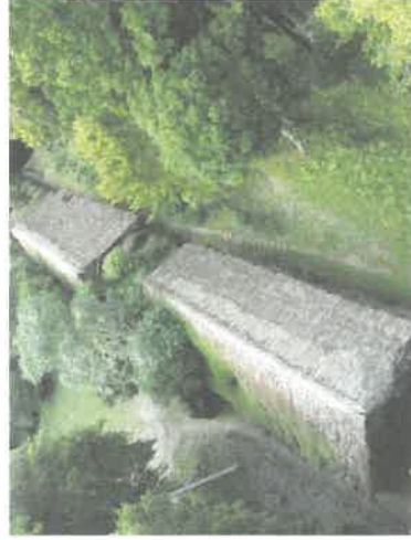
Fig. 2: Panorámica general (Vista norte – sur) de la cubierta establecida en los edificios 27, 218 y 219, la cual se encuentra en malas condiciones, mostrando deterioro y daños en estructura y acabado.

Replanteamiento, levantamiento planimétrico y altimétrico para la realización de la planificación para el cambio de cubierta para los edificios mencionados.